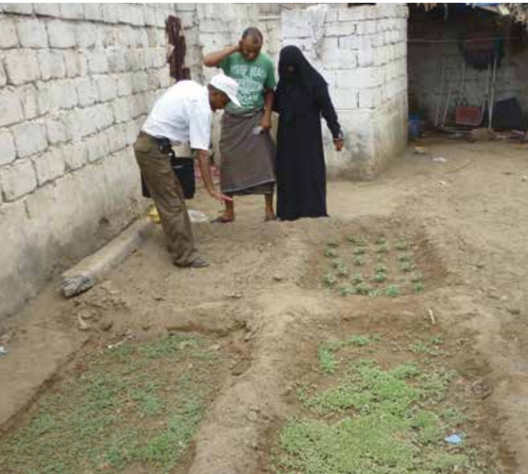
© Hanan | GFA Consulting Group