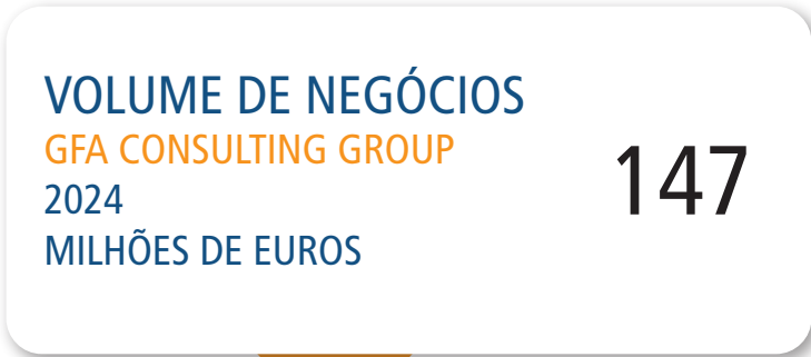
Volume de negócios das áreas estratégicas de negócios da GFA em 2024