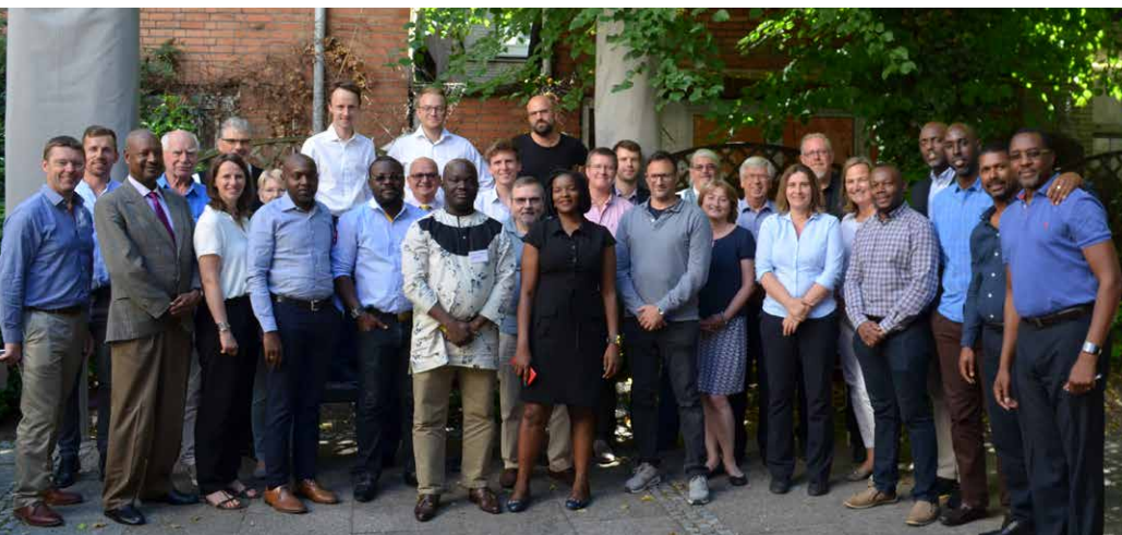
Participants GFA a la conférence

d'agent fiscal s'occupent de toutes les transactions financières pour le compte de l'entité chargée de la mise en œuvre, par exemple : paiement respectant les procédures convenues ou mécanismes de contrôle de sauvegarde et de mise en œuvre avec le bénéficiaire. Compte tenu du contexte de risque spécifique dans lequel les subventions du Fonds Mondial sont mises en œuvre, un examen plus approfondi des processus financiers et comptables peut être nécessaire. En outre, les procédures et systèmes existants peuvent nécessiter une mise à jour. L'assistance au renforcement des capacités et la formation en comptabilité et en gestion financière constituent une responsabilité clé.