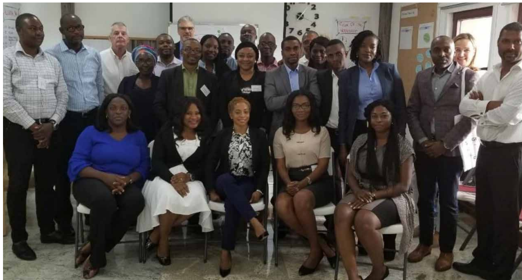
L'équipe des agents fiscaux de GFA au Nigeria

Contact : christophe.thielemans@gfa-group.de www.gfa-bis.de | www.c3-training.de