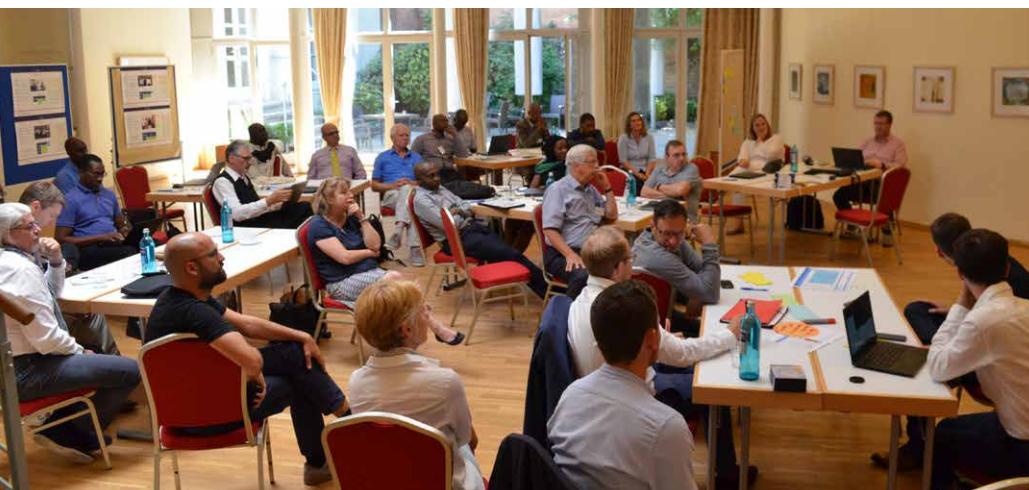
Session de travail sur les procédures standard

La troisième journée a été consacrée à l'échange de bonnes pratiques entre les entités de mise en œuvre. GFA a également présenté son siège et les bureaux du