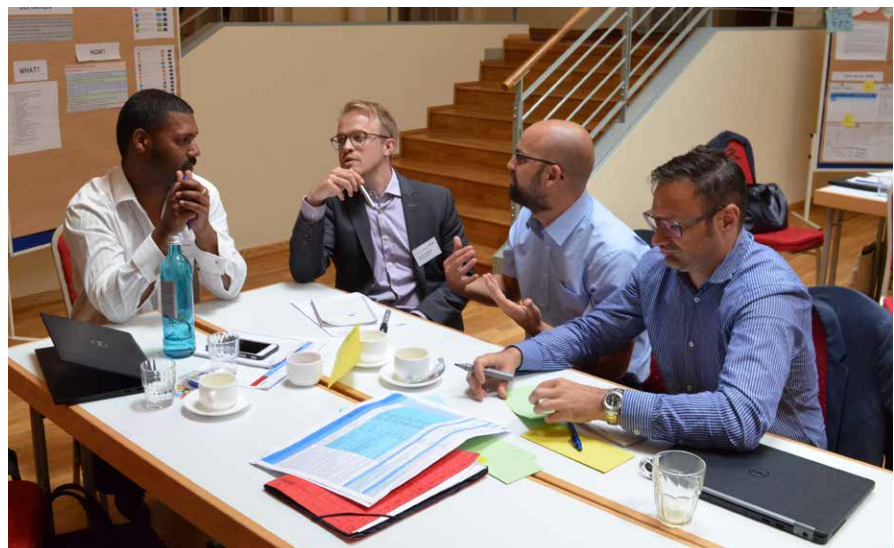
Groupe de travail sur les nouveaux concepts et outils développés par GFA

Les services de gestion financière de GFA pour les projets du Fonds Mondial dans dix pays sont spécifiquement adaptés aux maladies, aux pays d'exécution, à la capacité institutionnelle, et aux objectifs sectoriels et de projet. Les services comprennent la supervision financière, le renforcement des capacités en matière de comptabilité, de reporting, de budgétisation et de fonctions de contrôle interne standard adaptés aux besoins des bénéficiaires principaux et secondaires dans un pays donné. Les services d'agent fiscal sont tenus d'aider le bénéficiaire principal ou les sous-bénéficiaires à renforcer leurs capacités en matière de gestion financière et de gestion des achats. Les équipes de GFA atténuent le risque de fraude ou d'utilisation abusive des fonds de subvention, réduisent le nombre de plaintes, et améliorent l'efficacité de la gestion des fonds, conformément aux normes du Fonds Mondial. Les services