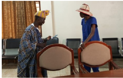
DeJésus Comedy Club en prestation