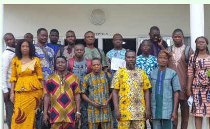
Photo de Famille des participants/ Etape du sud à Grand-Popo

Ces ateliers ont été initiés au profit des 47 porteurs de projets présélectionnés dans le cadre de l'AàP du FoSIR 2022 et ce sont déroulées en deux sessions: les 02 et 03 juin à Grand-Popo pour l'étape du Sud et les 08 et 09 juin 2022 à Parakou pour l'étape du Nord.